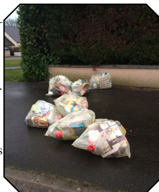
Sacs déposés semaine 9

Donc, soyez vigilants sur les dates de ramassage, ne mettez pas vos sacs trop tôt et surtout rangez-les lorsqu'ils sont porteurs d'une étiquette. Merci, pour le bien vivre ensemble